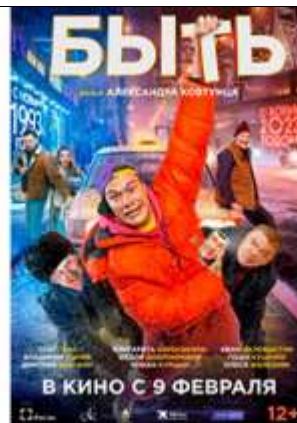
Быть (2023, Россия)

Поссорившись с сыном, царь Иван Грозный случайно ранит его — как на знаменитой картине Репина. Жизнь царевича на волоске. Чтобы все исправить, Грозный хочет отправиться в прошлое с помощью волшебного гримуара. Однако что-то пошло не так, и Грозный попадает в наше время, где знакомится с семьей Осиповых. Никита Осипов — неудачливый археолог и такой же неудачливый отец. Он давно потерял контакт с детьми — Ромкой и Полей. Но теперь они вместе отправляются в путешествие, чтобы помочь Грозному отыскать гримуар и спасти царевича.