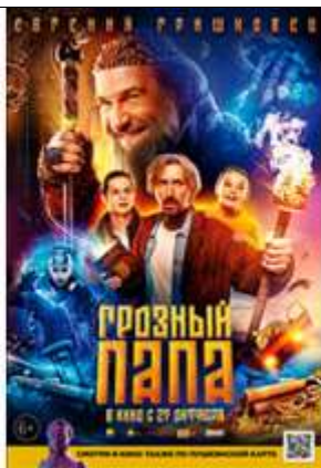
Грозный папа (2022, Россия)

В надежде отвлечь мальчика от утраты матери, отец везёт его к бабушке на зимнюю рыбалку. Но семья попадает в пургу и теряется на льду самого большого озера мира. Преодолеть горе и найти друг друга им поможет любовь и таинственные силы Байкала.